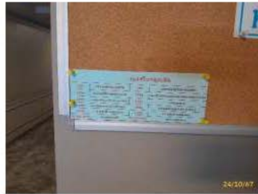
หมายเลขโทรศัพท์ฉุกเฉิน