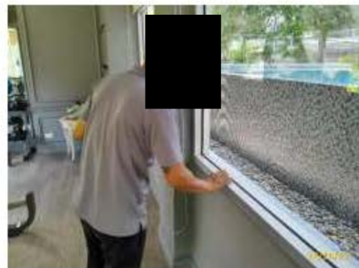
ผนังอาคาร และการตรวจสอบ