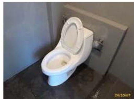
สุขภัณฑ์ชนิดประหยัดน้ำ