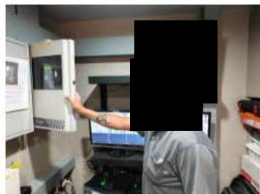
การตรวจสอบระบบป้องกันและระงับอัคคีภัย