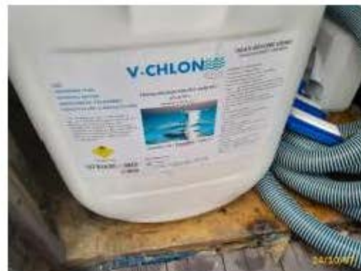
ฉลากสารเคมี