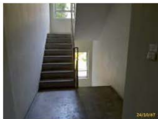
บันไดหนีไฟ ST-2

ภาพที่ 2.2-10 (ต่อ) การบริหารจัดการด้านอัคคีภัย ความปลอดภัย และการสาธารณสุข