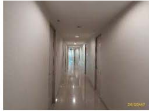
ระบบไฟฟ้าส่องสว่างโดยทั่วไป