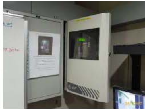
แผงควบคุม