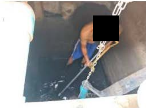
การเก็บขยะบริเวณตะแกรงดักขยะ