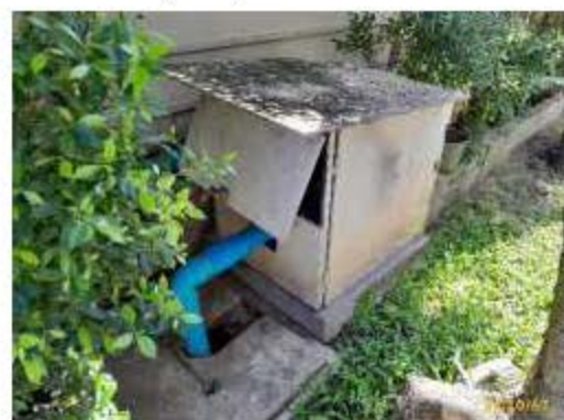
ภาพที่ 2.2-9 การบริหารจัดการระบบระบายน้ำ