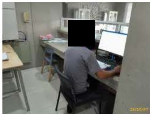
เจ้าหน้าที่ประชาสัมพันธ์/รับเรื่องร้องเรียน