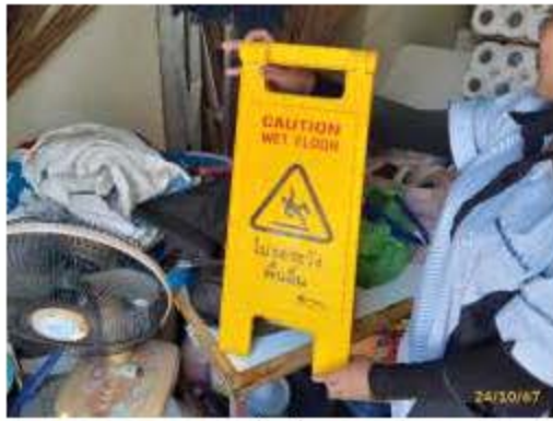
ป้ายเตือนกันพื้นที่ยื่นกีดกัน