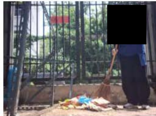
การทำความสะอาดห้องพักมูลฝอยรวม