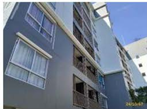
ราวกันตก 0.9 เมตร