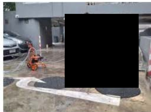
การทำความสะอาดถนน และลานจอดรถ