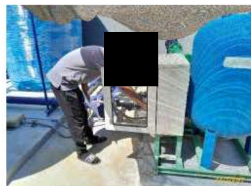
การตรวจสอบการทำงานระบบน้ำใช้