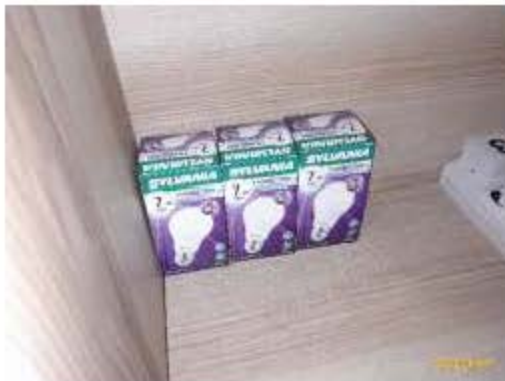
หลอดไฟฟ้า LED