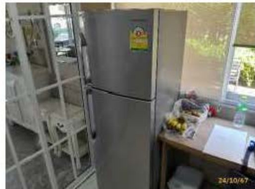
เครื่องไฟฟ้าประหยัต์พลังงาน