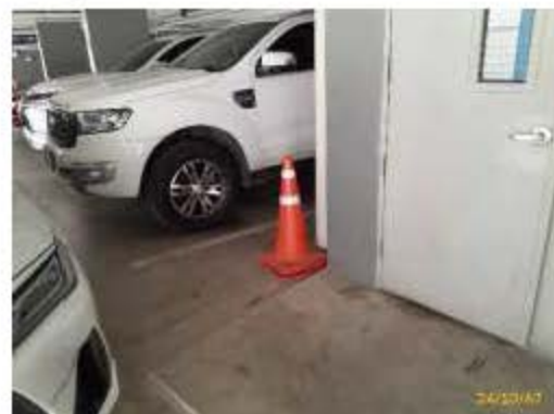
ป้าย/กรวยสำหรับกั้นพื้นที่กรณีเปิดฝาบ่อ

ภาพที่ 2.2-10 (ต่อ) การบริหารจัดการด้านอัคคีภัย ความปลอดภัย และการสาธารณสุข