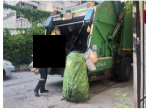
การเก็บขยะมูลฝอยของสำนักงานเขต