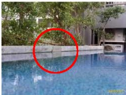
ป้ายบอกความลึกสระว่ายน้ำ