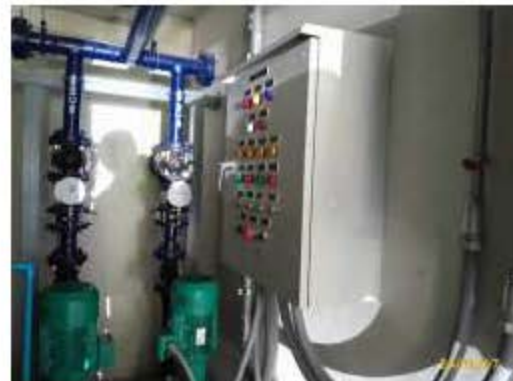
เครื่องสูบน้ำชั้นล่าง