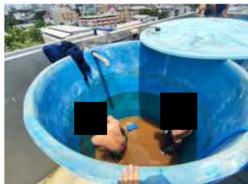
การล้างทำความสะอาดถังเก็บน้ำใช้