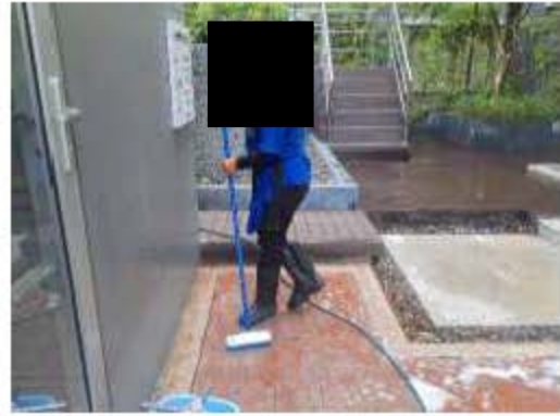
เจ้าหน้าที่ขณะทำความสะอาดรอบสระว่ายน้ำ