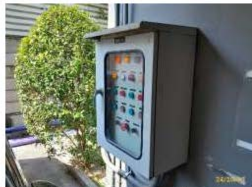
ตู้ควบคุมการระบายน้ำ