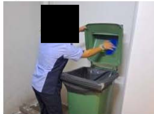
การทำความสะอาดห้องพักมูลฝอยประจำชั้น