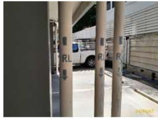
ท่อรวบรวมน้ำฝน