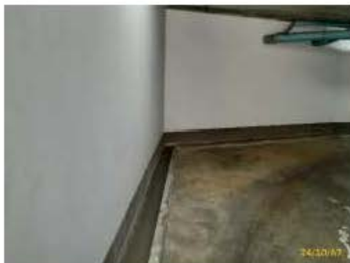
รางระบายน้ำฝน