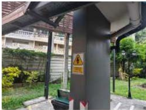
ภาพที่ 2.2-10 (ต่อ) การบริหารจัดการด้านอัคคีภัย ความปลอดภัย และการสาธารณสุข