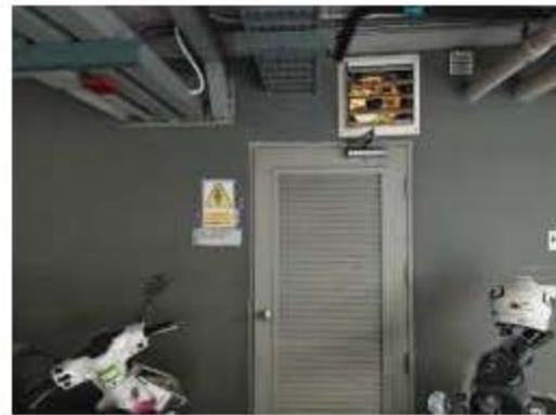
ป้ายเตือนอันตรายจากไฟฟ้า