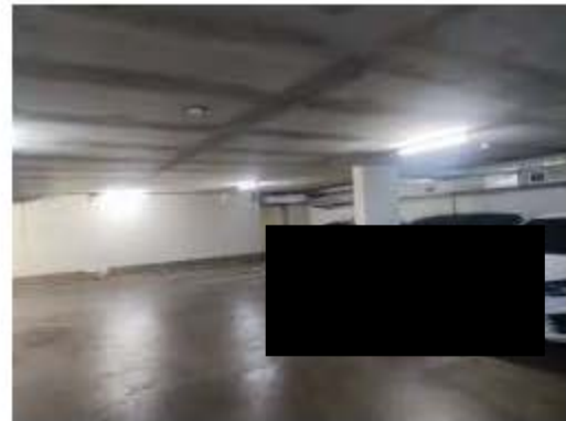
ระบบไฟฟ้าส่องสว่างบริเวณถนน ทางเข้า-ออก และลานจอด