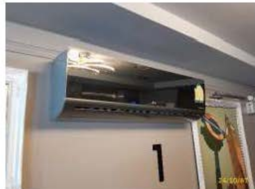
เครื่องปรับอากาศ