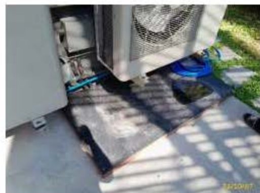
ระบบบำบัดน้ำเสียบริเวณอื่นๆ