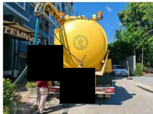
การสูบน้ำออกส่วนเกิน/ไขมัน