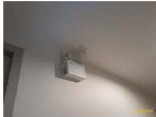
ไฟส่องสว่างฉุกเฉิน