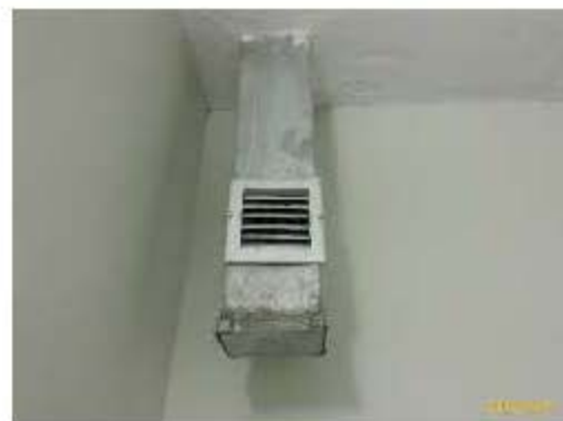
ห้องพักมูลฝอยประจำชั้น