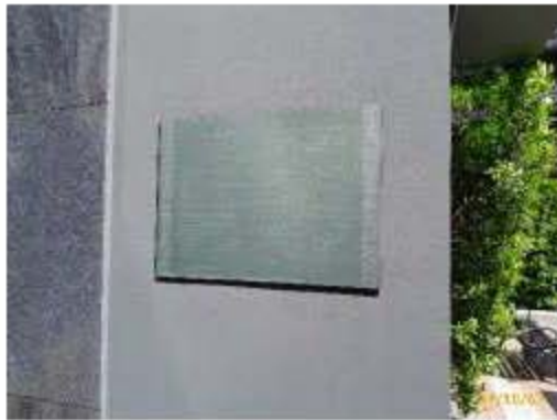
ข้อปฏิบัติสำหรับผู้ใช้บริการสระว่ายน้ำ