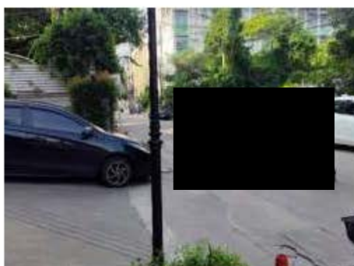
เจ้าหน้าที่ฯ อำนวยความสะดวกด้านการจราจร