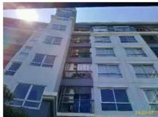
การติดตั้งแผงระบายอากาศเครื่องปรับอากาศ