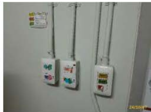
สวิตช์ไฟฟ้าแยก