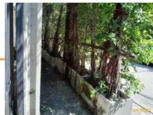
พื้นที่สีเขียวบริเวณชั้นล่าง ภาพที่ 2.2-3 (ต่อ) การบริหารจัดการพื้นที่สีเขียว และการดูแล