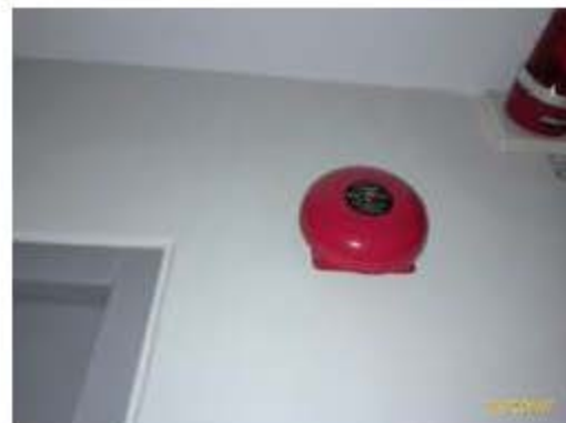
อุปกรณ์แจ้งเหตุเพลิงไหม้ด้วยเสียง