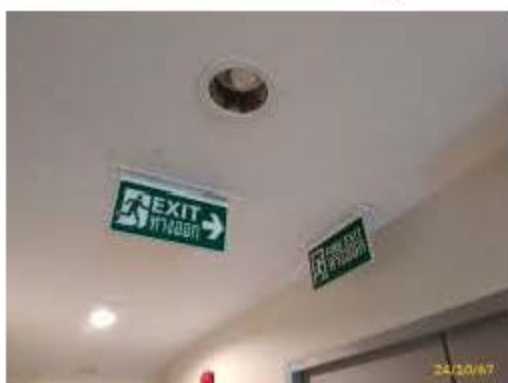
ป้ายบอกทางหนีไฟ