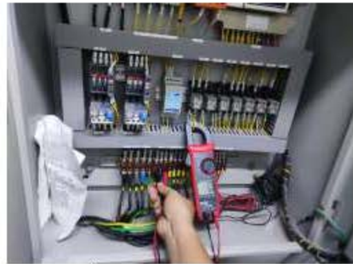
การตรวจสอบการทำงานของระบบบำบัดน้ำเสีย