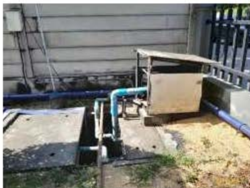
บ่อพักน้ำสุดท้ายก่อนระบายลงรางสาธารณะ