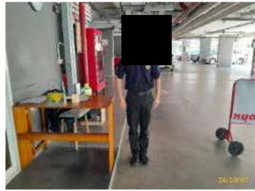
เจ้าหน้าที่รักษาความปลอดภัย