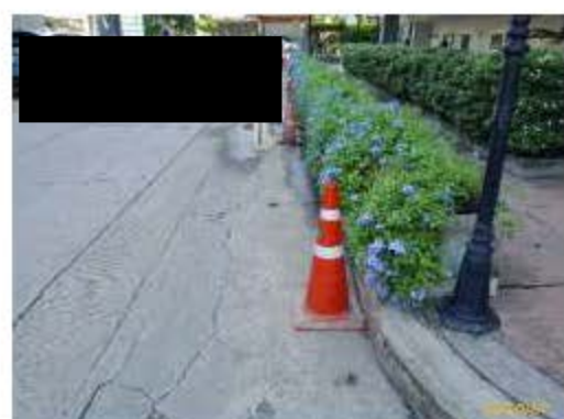
ทวอยแสดงการห้ามจอดบริเวณด้านหน้าโครงการ