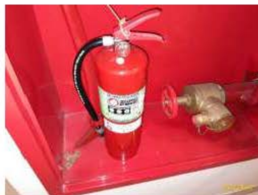
ตู้เก็บสายฉีดน้ำดับเพลิงและท่อยื่น