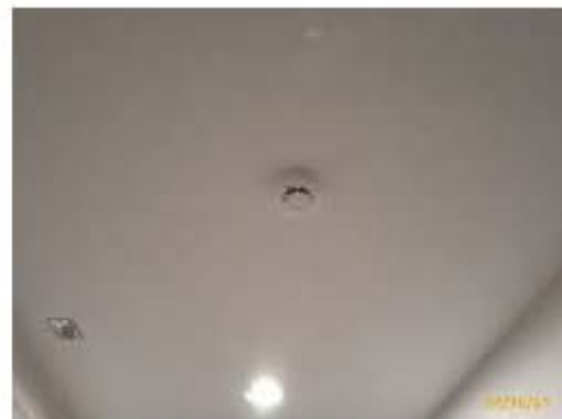
อุปกรณ์ตรวจจับความร้อน/อุปกรณ์ตรวจจับควัน