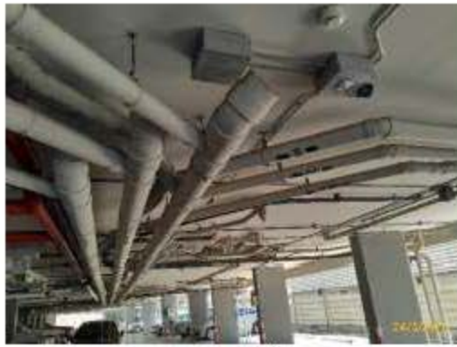
ท่อรวบรวมน้ำเสีย