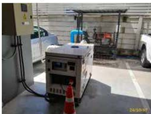
ระบบระบายน้ำสำรอง