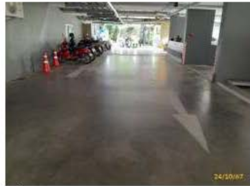
สัญลักษณ์จราจรบนพื้นทาง