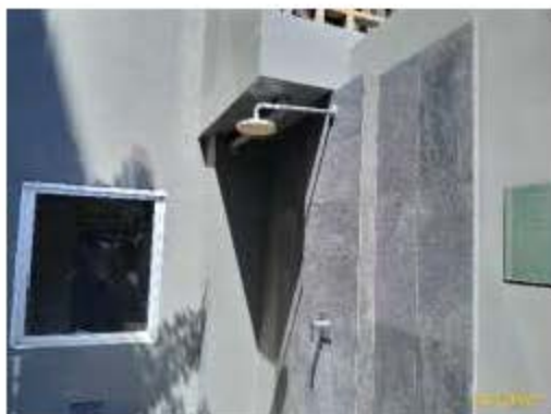
พื้นที่ล้างตัว-ล้างเท้า