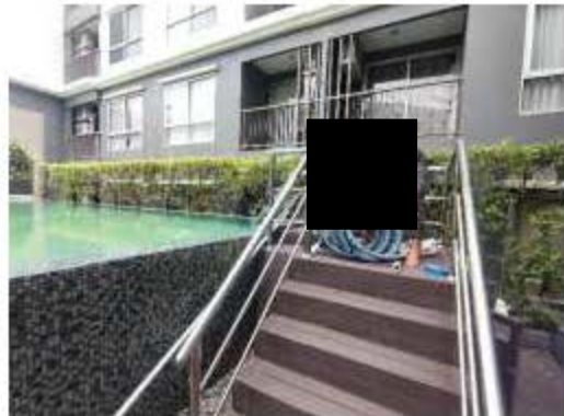
เจ้าหน้าที่ขณะทำความสะอาดสระว่ายน้ำ