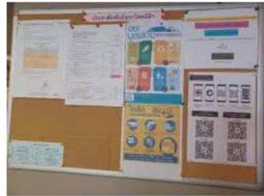
ประชาสัมพันธ์การใช้ไฟฟ้าอย่างประหยัด