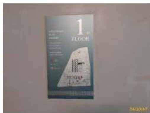
แผนผังอาคาร