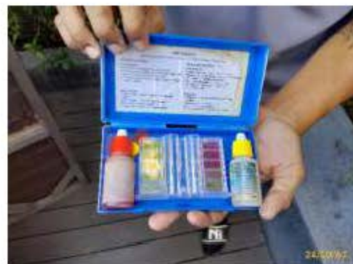
เครื่องมือวัด pH และ Cl

ภาพที่ 2.2-12 (ต่อ) การบริหารจัดการสระว่ายน้ำ