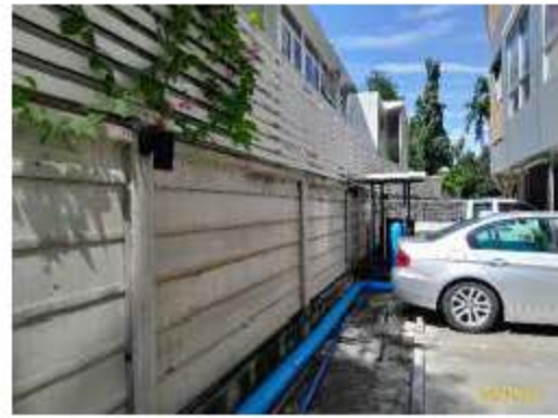
รั้วโดยรอบพื้นที่โครงการ