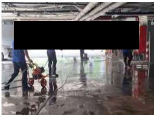
ภาพที่ 2.2-9 (ต่อ) การบริหารจัดการระบบระบายน้ำ