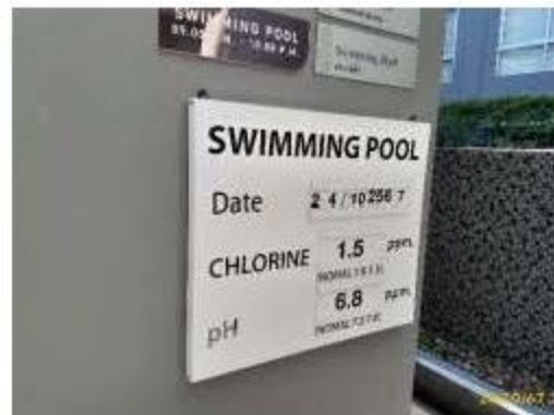
ป้ายตรวจวัด pH และ Cl ประจำวัน