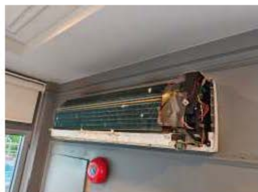
การล้างทำความสะอาดเครื่องปรับอากาศ