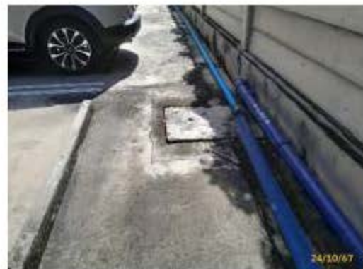
บ่อพักน้ำ