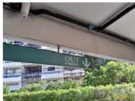
ป้ายจราจร