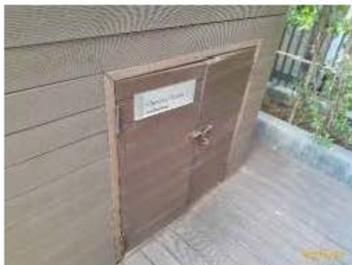
ป้าย 'ห้องเก็บสารเคมี'