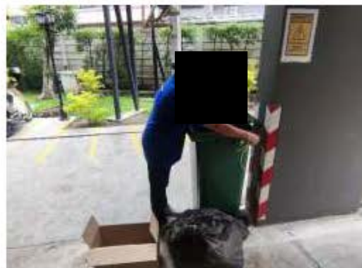
เจ้าหน้าที่ฯ ณะรวบรวมขยะในแต่ละชั้น