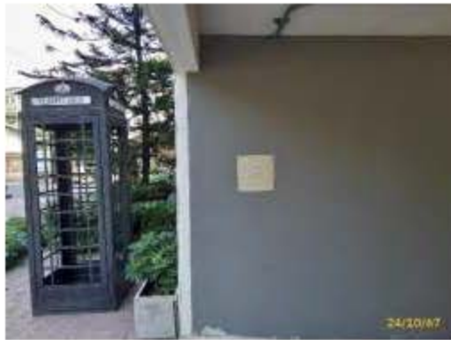
จุดรวมพล