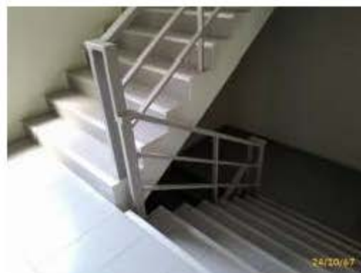
บันไดหนีไฟ ST-1