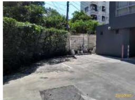
ระบบบำบัดน้ำเสีย