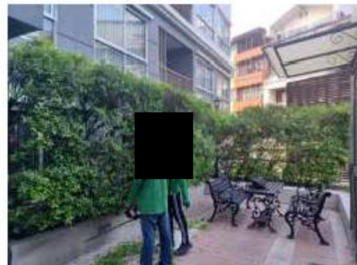
การดูแลพื้นที่สีเขียว